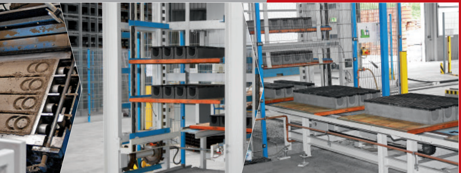
Stockage sur rayonnages