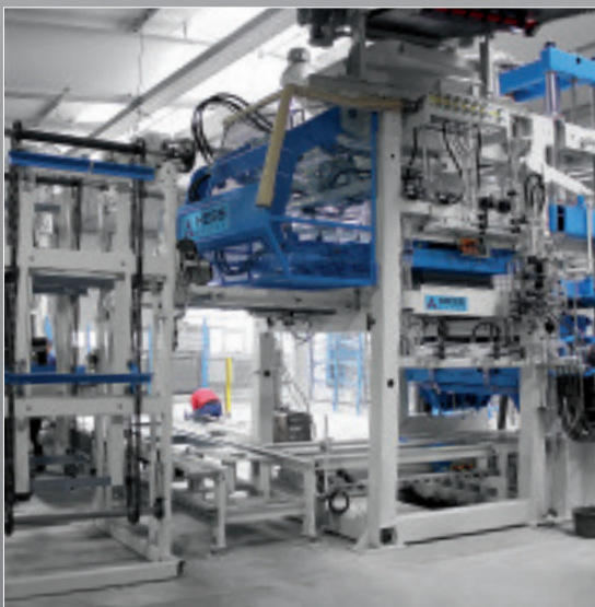
Machine de la nouvelle chaîne de production de caniveaux