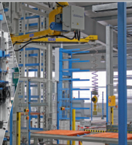
Chariot de machine prêt à recevoir les caniveaux