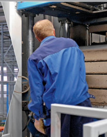
Machine en action