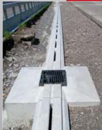
Flächenabdeckung BGS Ermatic Vollguss Klasse D400 im Standstreifen