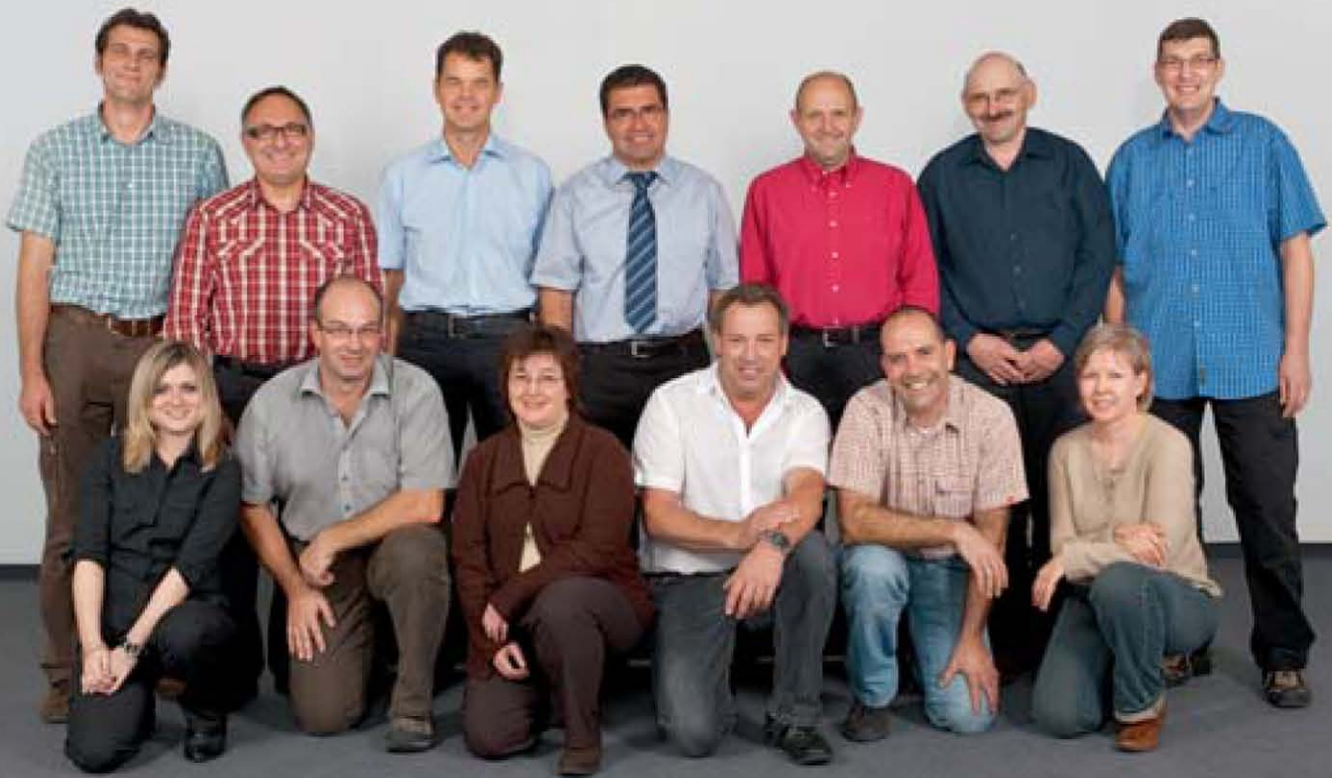
Das komplette BGS-Team