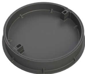
Figur 470 Figur 476