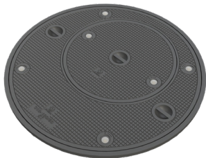
Figur 318 Figur 319