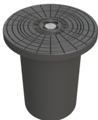
Figur 10SN Figur 20SN